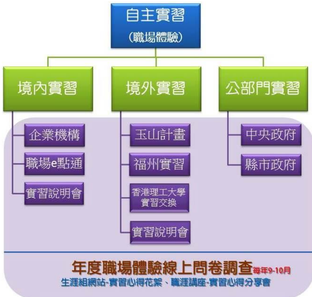
生涯組自主實習業務分類圖